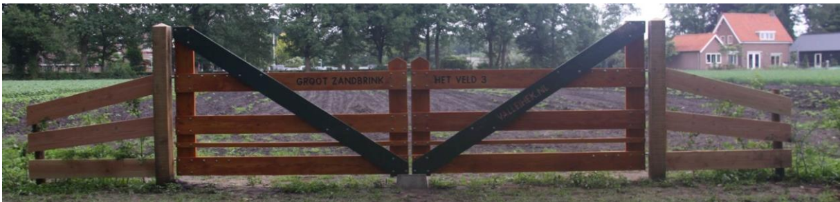
HEK 4: - Douglas hout - 4 meter breed - Schaaldelen