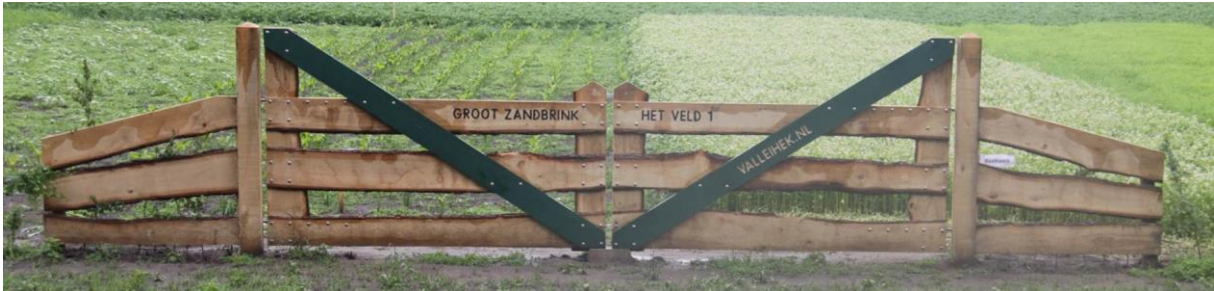
HEK 2: Eikenhout - 4 meter breed - Rechte planken