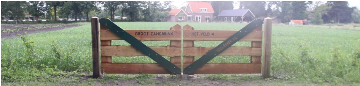
HEK 3: Douglas hout - 5 meter breed - Rechte planken - behandeld met Ecoleum - Vleugels - Lamlat